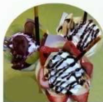
カフェカラカラ ※22日のみ