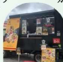
レイワラボキッチン