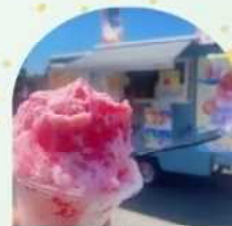
カラアゲアゲロー ※21日のみ