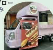
ワンスキッチンカー ※21日のみ